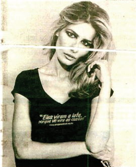
Yasmin Brunet: campanha em defesa dos animais